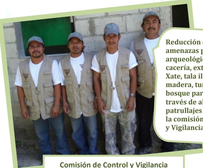
Comisión de Control y Vigilancia

Reducción de las amenazas por saqueos arqueológicos, cacería, extracción de Xate, tala ilegal de madera, tumba de bosque para milpa. A través de al menos 2 patrullajes al mes por la comisión de Control y Vigilancia.