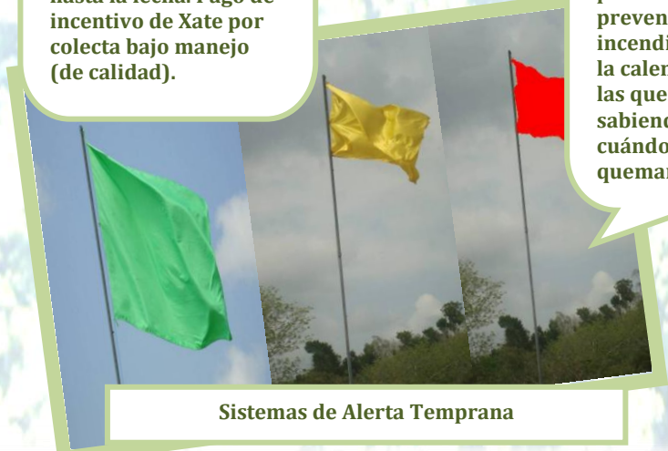
Sistemas de Alerta Temprana

Implementación de Sistemas de Alerta Temprana como un procedimiento para la prevención de incendios, además de la calendarización de las quemas agrícolas, sabiendo dónde, cuándo y quién quemará.