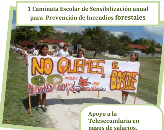
1 Caminata Escolar de Sensibilización anual para Prevención de Incendios forestales

Reducción de las amenazas por saqueos arqueológicos, cacería, extracción de Xate, tala ilegal de madera, tumba de bosque para milpa. A través de al menos 2 patrullajes al mes por la comisión de Control y Vigilancia.