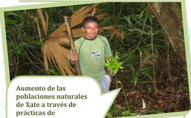
Enriquecimiento de Xate en áreas de bosque

Aumento de las poblaciones naturales de Xate a través de prácticas de enriquecimiento, logrando la inserción de 121,000 plantas hasta la fecha. Pago de incentivo de Xate por colecta bajo manejo (de calidad).